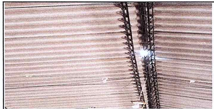
Foto 6: Se Observa el deterioro de capote de laminas del modulo 2

Observación: Si es necesario se pueden agregar hojas adicionales y actualizar el número de hojas.