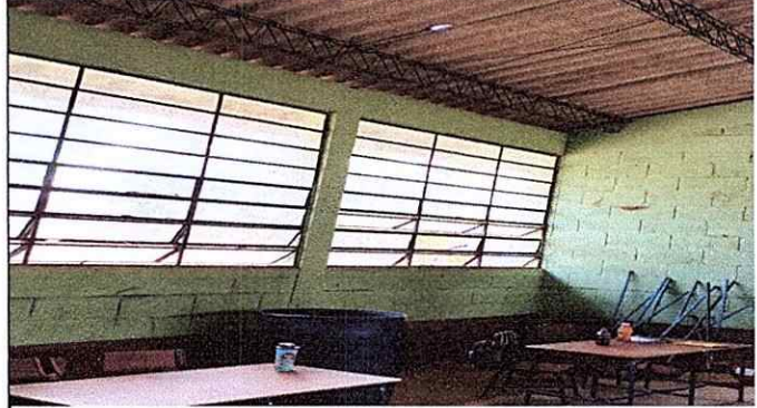
Foto 2: Se Observa el deterioro de las estructuras metalicas del modulo 1