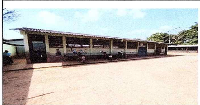
Foto 4: Se observa el deterioro de la lamina del segundo modulo 2