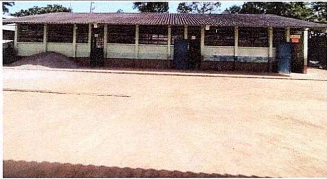
Foto1: Se observa el deterioro de las laminas modulo 1